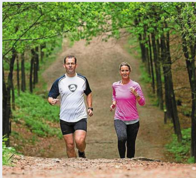
Loop mee op zondag 3 september.

Deelname Deelname is gratis, maar wie mee wil lopen moet zich wel aanmelden via nm.nl/agenda.