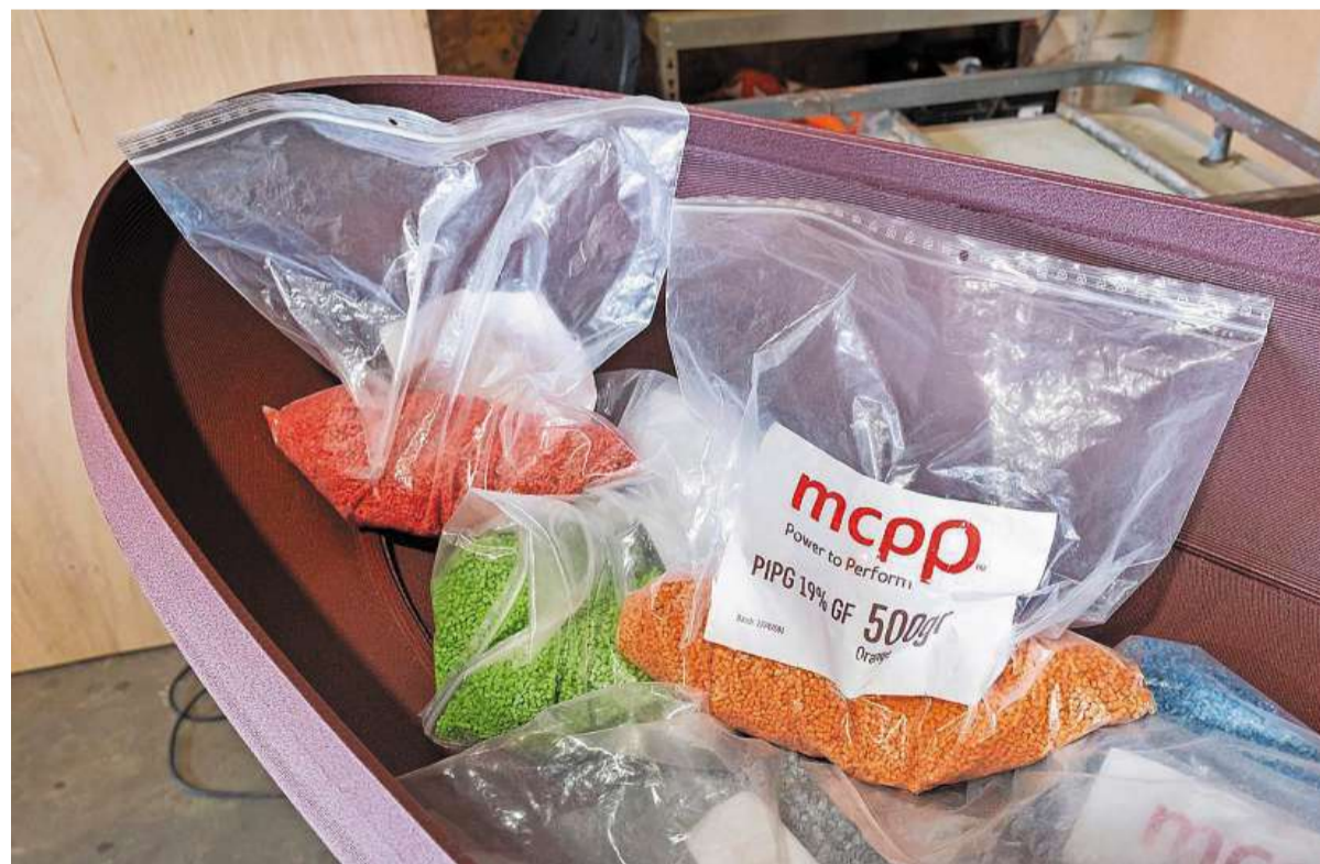
De gekleurde afvalkorreltjes: de boten zijn te bestellen in vijf kleuren.