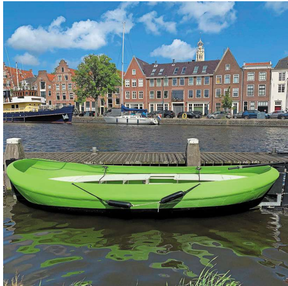
De groene D3aak ligt bij de Vissersboot in het Spaarne.

WATERKANT Sloep is geprint met industrieel afval